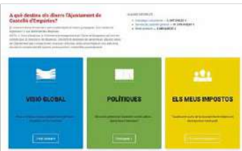
El nou portal vol acostar la ciutadania a la gestió dels comptes municipals.

"Inicialment, l'aplicació utilitza un patró bàsic, però la intenció és anar introduint més paràmetres per fer-la més precisa", explica Jaume Planella, regidor de Transparència i Govern Obert. Al mateix web, dos apartats més, Visió Global i Polítiques, per-