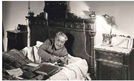
JOSEP PLA. Al llit de l'habitació del mas Pla, un any abans de la seva mort

El passat dia de Sant Jordi va fer 40 anys de la mort de l'escriptor Josep Pla. Tot i que l'òbit va produir a la casa parat, al Mas Pla de Llofriu, un nucli situat a tocar de Palafrugell, va anar de poc que el fatal desenllaç no es produís a Figueres, una ciutat que admirava i de ben jove que va deixar ben clar al «Quadern gris», el seu dietari de joventut, on entre altres referències confessa: «De vegades penso en la ciutat de Figueres. És un lloc on m'agradaria viure o almenys on em sembla que viuria fàcilment. (...) El primer descolchament del món. Entrada en la seva correntia, se'm produí per Figueres. (...) La ciutat fou el primer nucli urbà que hegués vist en la vida.»