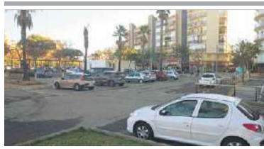
L'aparcament, on s'ajustaran espais dels parterres i es reformaran accessos ■ E.A.