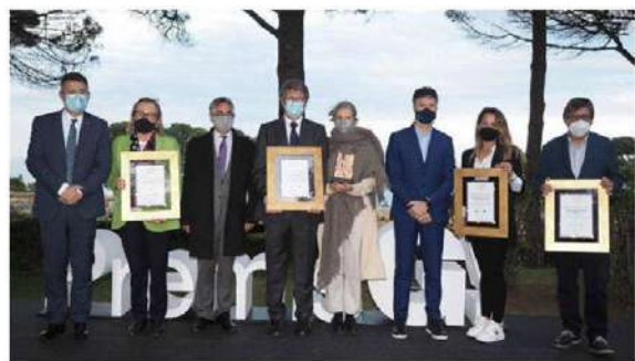
El lliurament s'ha fet al jaciment d'Empúries.

06-05-21 | 19:35 | Actualitzat a les 16:24