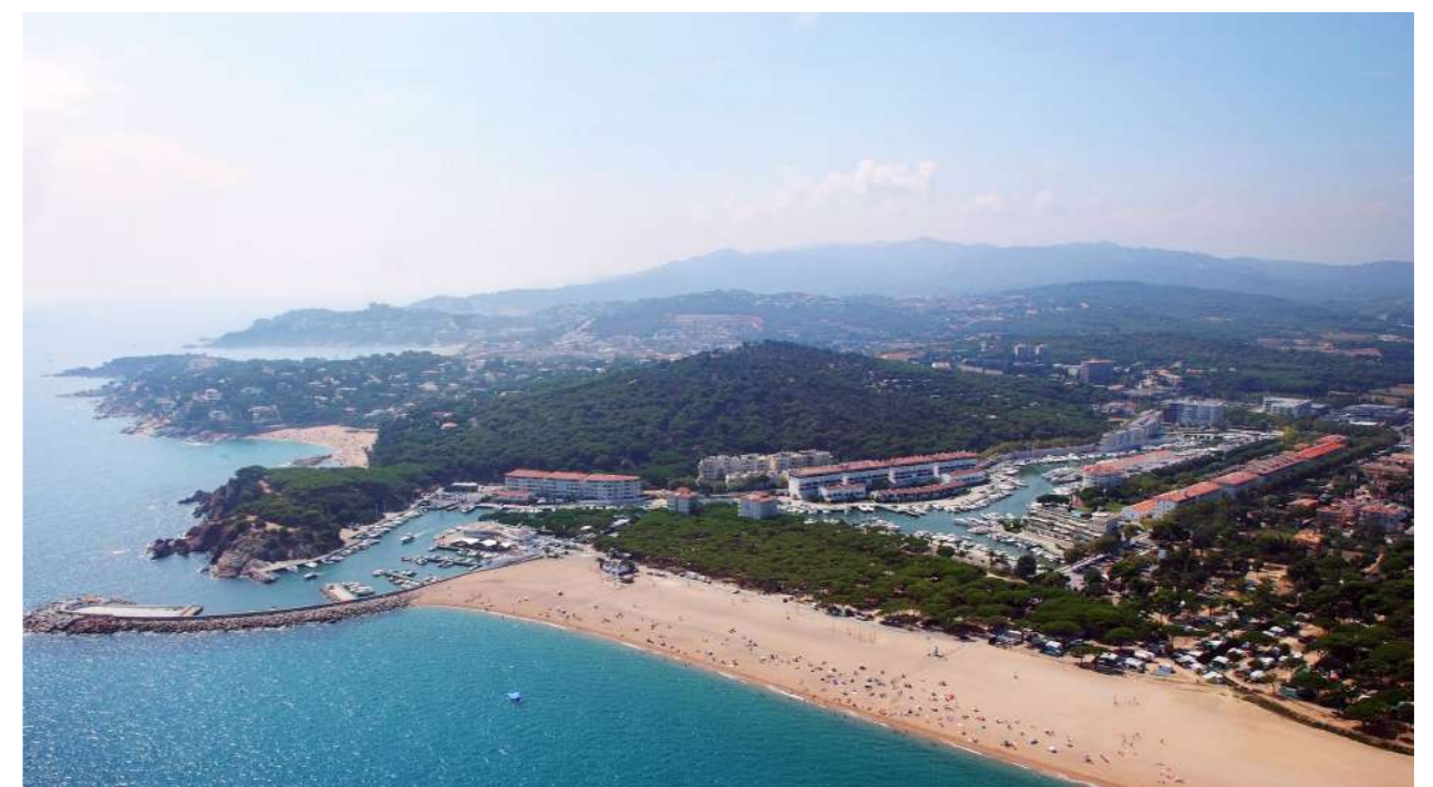
Platja d'Aro.

“El futur del turisme depèn de la nostra capacitat d'adaptació i del treball”