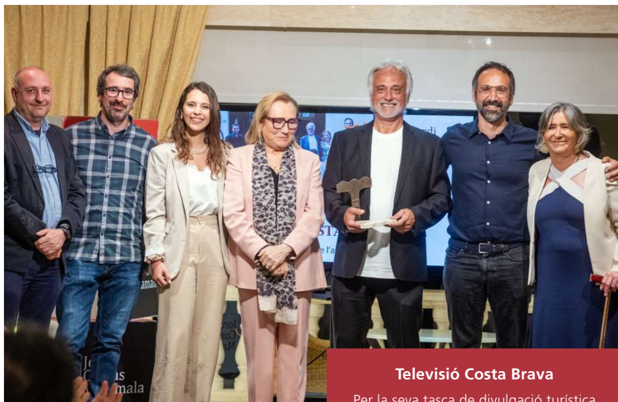
Televisió Costa Brava Per la seva tasca de divulgació turística