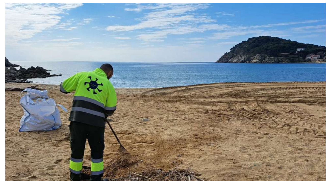
Platja de Sant Esteve de la Fosca.

“No hi ha altre camí que poder incrementar l’impost”