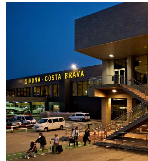
Vilobí d'Onyar. Raul Urbina. Arxiu Imatges PTCGB

En definitiva, l'Aeroport Girona-Costa Brava afronta el futur amb un ferm compromís amb el territori i una visió clara: ser una infraestructura moderna, sostenible i competitiva, capaç d'impulsar la connectivitat, atraure talent i inversió, i contribuir a la projecció global de les nostres comarques. Amb el suport institucional, la diversificació de mercats i l'aposta per esdeveniments estratègics com la Ryder Cup i la construcció de l'estació d'alta velocitat, l'aeroport té tots els ingredients per convertir-se en un referent europeu en mobilitat i desenvolupament turístic.