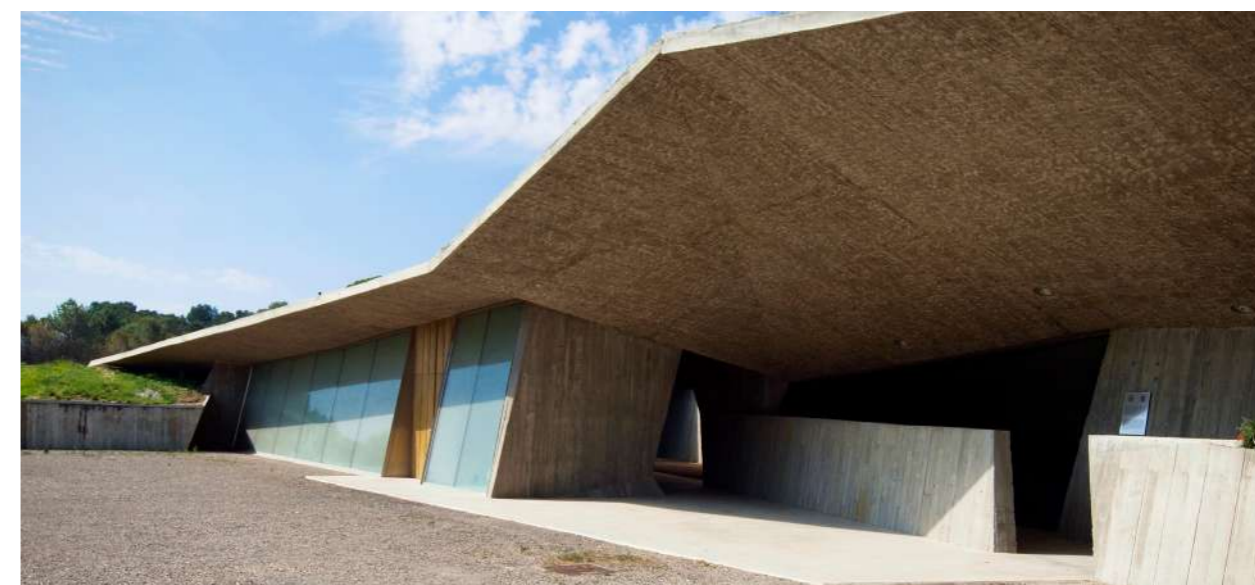
COAC, Museu Arqueològic d'Empúries

“És una oportunitat extraordinària per projectar internacionalment el talent”